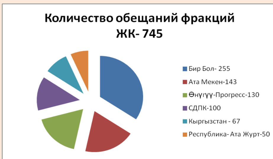
Диаграмма 1. Общее количество предвыборных обещаний политических партий/фракций ЖК КР.

«МЦ Интербилим» осуществил подсчет и категоризацию предвыборных обещаний 6 партий по сферам: экономическая, социальная и политическая.