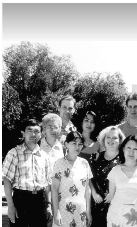
Сотрудники Центра «Интербилим»

В результате начатой в конце 2002 года работы по созданию сети детских НПО были получены следующие результаты: детские НПО ближе узнали друг о друге; предложения от детских НПО -участников кампании ЦИБ по усовершенствованию детского законодательства были переданы в Рабочую группу при секретариате национальной программы «Новое поколение»; появились совместные проекты; началась работа по получению рекомендаций от потенциальных участников сети. Можно сказать, что сетевая работа между детскими НПО налаживается. Есть заинтересованность в создании работающей и устойчивой сети. Огромная роль в продвижении сети принадлежит детским ЦГ ЦИБ. Предстоит еще много сделать.