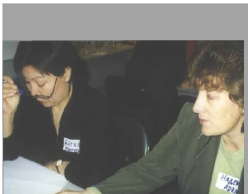
Совместное подведение итогов.

ЦИБ постоянно помогает реализовать продукцию сделанную клиентами ЦГ. Например, ЦИБ реализовал продукцию пожилых людей из «АДРА-Кыргызстан» на сумму 3 тыс. сомов, Центра защиты детей – на 2 тыс. сомов, Ошский ресурсный центр «Интербилим» (далее ОРЦ) для кредитной группы «Алай-Ата-Журт» - на 1245 сомов.